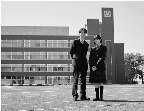
ば十分にクリアできる基準です。