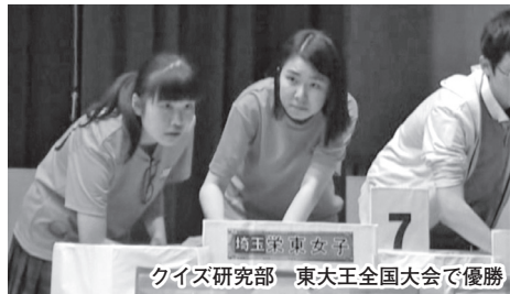
クイズ研究部 東大王全国大会で優勝

いきます。このような活動を通して、主体的な学習態度やプレゼンテーション能力を育むことが目的です。