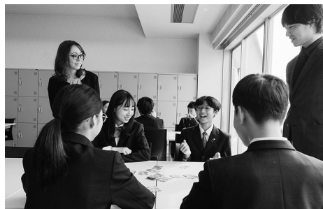
今年の進学実績については巻末の「高校別大学合格者数一覧」をご覧ください

〈貢献〉とは、三田国際学園の学びの姿勢です。授業を聞き、ノートに書き写して覚え、先生が求めているであろう予定調和的な答えにたどり着くことだけでは〈貢献〉ではありません。自分自身で考え、自分の意見を表明することこそ、クラス全体の学びに貢献できるという考え方です。〈貢献〉によって醸成される学園の文化は、豊かな水をたたえる大地のように、生徒のあふれるエネルギーを受け止め、世界へと羽ばたいていくための力をぐんぐん伸ばしていきます。