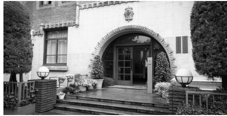
第二キャンパス (旧京華女子中高校舎)

を導入し、各自の進路に合わせたカリキュラムが用意されています。3年間、海外にいる外国人講師とマンツーマンでオンライン英会話の授業があります。また、「探究」の授業では、企業からミッションをもらい、よりよい社会を創るという目的のもと課題解決をグループで行っていきます。