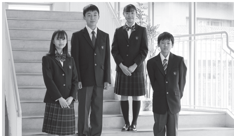
2023年度入学生から制服リニューアル