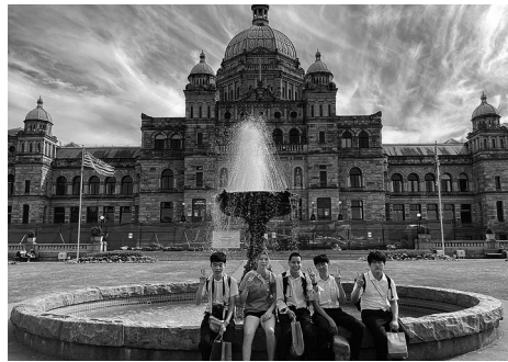
高校1年生全員参加の海外(写真はカナダ・ビクトリア)研修

世田谷学園の6年間は、中学1・2年生を前期(1・2年)、中学3年・高校1年生を中期(3・4年)、高校2・3年生を後期(5・6年)として位置づけ、大学現役合格を意図した進路別・学力別のカリキュラムを組んでいます。とくにコンパス(各教科の学習指針を示したもの)を学年別にWeb上で閲覧でき、自主的・計画的に学習が進められるようにしています。