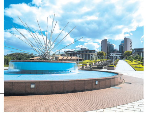
八王子キャンパス

〈八王子キャンパス〉〒192-0982 東京都八王子市片倉町1404-1 広報課 ☎ 0120-444-903 〈蒲田キャンパス〉〒144-8535 東京都大田区西蒲田5-23-22 広報課 ☎ 0120-444-925