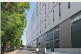
2018年5月より新病院棟(1号館)も稼働中

(4) WPI-Bio2Q ( https://bio2q.keio.ac.jp/ ) WPIは、高度に国際化された研究環境と世界トップレベルの研究水準を誇る国際研究拠点形成する事業。2022年に採択された慶應義塾大学ヒト生物学・微生物叢・量子計算研究センター(Bio2Q)は、日本で初めてのマイクロバイオーム研究拠点である。マイクロバイオームとヒトとの相互作用を分子レベルで明らかにするため、従来の生物学的手法とともに量子コンピューター技術を用いる。