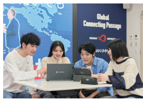
新施設での学びの様子

興味や目標に合わせて学ぶことで学生生活や人生を彩り豊かに 「専門教育」「全学共通教育」「正課外教育」という3つの要素が密接に連携しながら、学生を成長へと導く甲南大学の多彩な教育「彩り教育」。