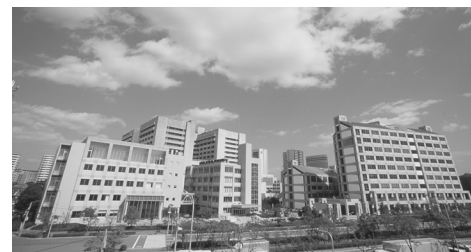
ポートアイランドキャンパス

教職支援センターでは、教員採用試験に関する対策や相談など先生を目指す学生をサポートしています。都道府県ごとの採用試験の傾向などを踏まえた対策、面接や模擬授業の練習など徹底的な実践対策で先生を目指す学生を支援しています。