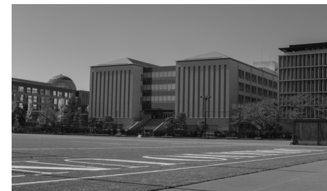
教室や図書館などの施設が集まる天野貞祐記念館(左奥) 教室棟「東棟」(中) 学生センター(右)

長期留学 には、主に交換留学と認定留学の2つの制度があり、いずれも留学期間中、獨協大学または留学先のどちらか一方の授業料は免除され、留学先で取得した単位は最大32単位まで卒業単位として認定されるため、留学期間を含めて4年間での卒業を目指すことも可能です。