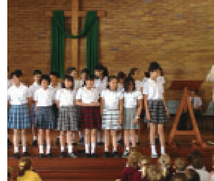
オーストラリア・ホームステイ

船旅というクルーズのような優雅なイメージがあるかもしれませんが、児童は乗船すると船員帽をかぶり、「小さな乗組員」として船内や寄港地での活動に取り組みます。東海汽船の船員さんたちが本当に子どもたちに愛情を注いでくださり、ブリッジや機関室など、普段立ち入ることができないところの見学も許されています。