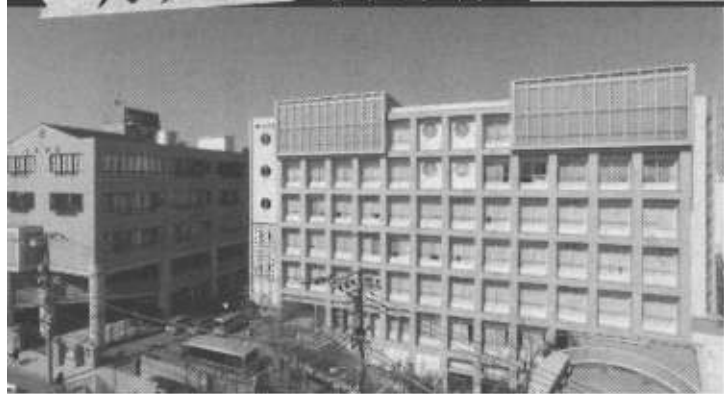
駒込中学校・高等学校